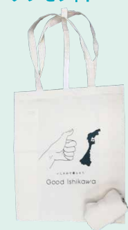
オリジナルトートバッグ